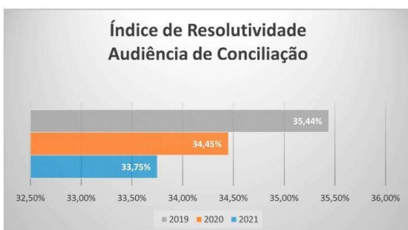
Gráfico 3. Índice de Resolutividade de Audiência (2019-2021)

Fonte: Elaborado pela autora a partir de dados do Sindec (2022).