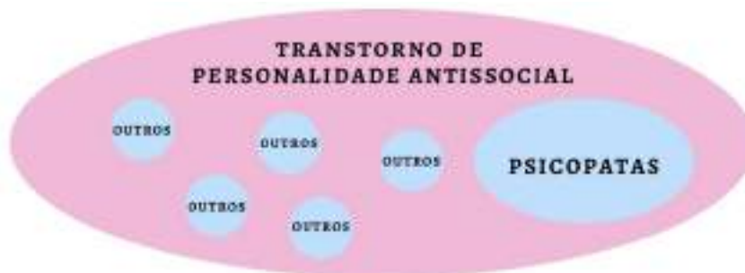
Figura 1- Ilustração da afirmação da Dra. Hilda Morana

Por outro lado, na CID-10, os critérios para o diagnóstico de transtorno antissocial identificam as condições de personalidade que tanto podem adquirir o feitiço de psicopatia, como o de condições mais atenuadas do comportamento antissocial. Em outras palavras a maioria dos psicopatas preenche os critérios para transtorno antissocial, mas nem todos os indivíduos que preenchem os critérios para transtorno antissocial são necessariamente psicopatas (MORANA, 2003). Ilustrando esta afirmação: