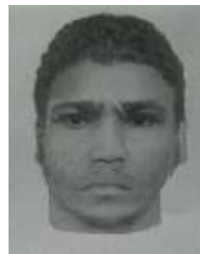
Figura 10 - retrato falado do Maníaco do Parque antes de ser identificado civilmente. Este foi o retrato que os veículos de comunicação divulgaram à época.