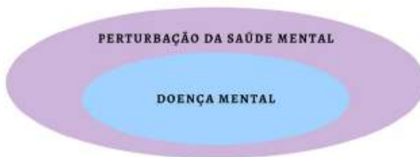
Figura 3 - Perturbação da saúde mental e doença mental

Prosseguindo para a segunda nomenclatura que o Parágrafo Único trás. Comparando o dispositivo 26 como um todo, vemos que no caput o artigo emprega “doença mental”, e no Parágrafo usa os termos “perturbações da saúde mental”. É certo que toda doença mental constitui perturbação da saúde mental. Mas nem toda perturbação da saúde mental constitui doença mental (DE JESUS, 2012). Ilustrando a frase de Damásio, tem-se: