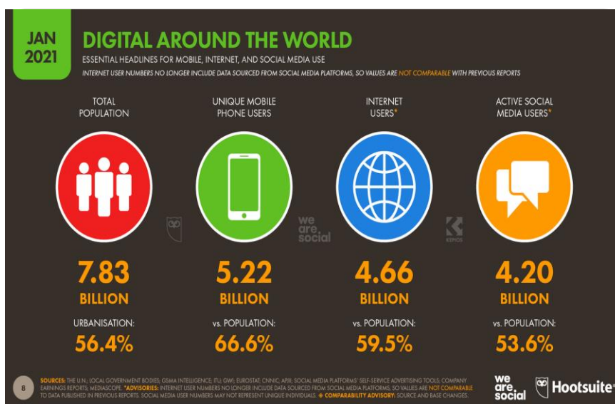
FIGURA 1 – COMPARATIVO